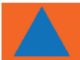
Рис. 2. Голубой треугольник на оранжевом фоне